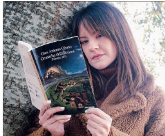
Il libro Cronache dell'alluvione, regalato a tutti i nostri lettori in occasione dei 70 anni della rotta del Po. A destra il Diario scolastico, in omaggio in 50mila copie ai ragazzi delle scuole primarie di quattro province del Veneto

luzione che ha cambiato la storia di questa terra. E La Voce ha contribuito a quel ricordo, doloroso ma al tempo stesso di stimolo per guardare al futuro, con un'iniziativa importante. Abbiamo infatti regalato a tutti i lettori una preziosa ristampa del libro che ha reso celebre lo scrittore polesano Gian Antonio Cibotto: "Cronache dell'alluvione". Un libro che è entrato a far parte della storia di questa terra, e che è finalmente tornato nelle case di migliaia di polesani. E assieme al libro, abbiamo regalato uno "Speciale" interamente dedicato a quei giorni, con tante foto